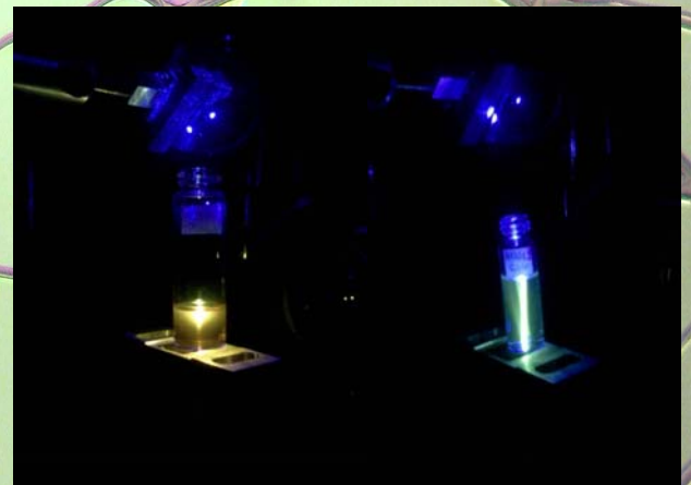
Emisión de nanopartículas de CdSe